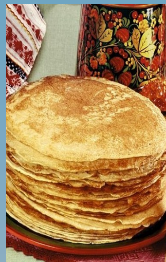
Масляный круглый блин - символ солнца, цикличности времени, счастливых дней, хороших урожаев, а также крепких браков, здоровых детей, единения семьи, друзей и рода.

Праздник принято отмечать на протяжении последней недели в преддверии Великого поста, который оканчивается Пасхой .